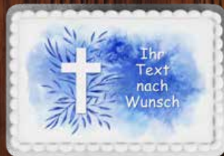
18 Kommunion Blau