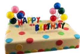
435 Happy Birthday