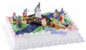
017 Sieben Zwerge

Wählen Sie aus unseren beliebten Füllungen: Schwarzwälder, Schoggi, Vanille oder Erdbeerquark. Alle unsere Torten sind ohne Alkohol.