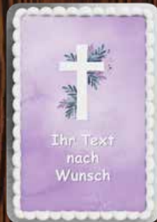
23 Kommunion Lila