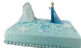
419 Eiskönigin Elsa